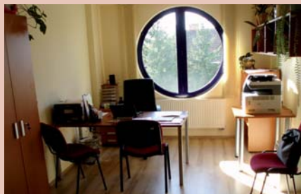
Kancelária regionálneho centra pre hodnotenie sústavného vzdelávania sestier a pôrodných asistentiek v Prešove