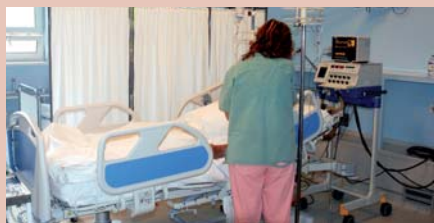
Ošetrovanie pacienta na jednotke intenzívnej starostlivosti, NSP Dunajská Streda