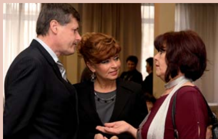
Diskusia počas konferencie Projekt hodnotenia sústavného vzdelávania sestier a pôrodných asistentiek – prvé výsledky a skúsenosti v Bratislave 06. 04. 2011