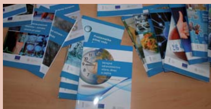
Knižné publikácie vytvorené v rámci projektu Úradu verejného zdravotníctva SR

Po skončení realizácie bude projekt vzdelávania zdravotníckych zamestnancov pokračovať prostredníctvom dostupného e-learningového vzdelávania. Budú sa tak môcť ďalej vzdelávať noví zamestnanci, zamestnanci v trvalom pracovnom pomere si tu naďalej nájdu nové poznatky z odboru, resp. z odborov viažucich sa na problematiku verejného zdravotníctva. Zodpovednosť za aktualizáciu nesú vedúci odborov.