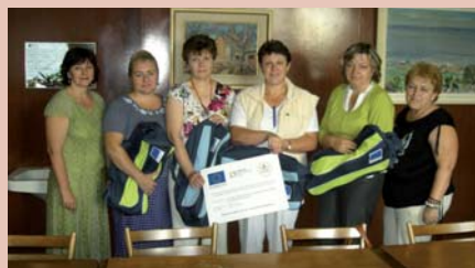
Frekventantky - zdravotné sestry v Nemocnici s poliklinikou Štefana Kukuru Michalovce, a.s., spolu s projektovým tímom nemocnice