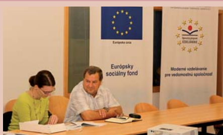
Informačný seminár k vyhlásenej výzve OPV 2011/2.2/01 v Bratislave 02. 08. 2011