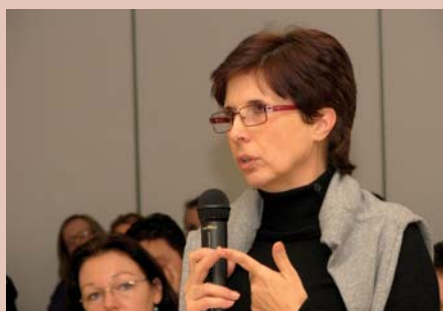
Diskusia počas informačného seminára k vyhlásenej výzve OPV 2010/2.2/02 v Bratislave 14. 01. 2011