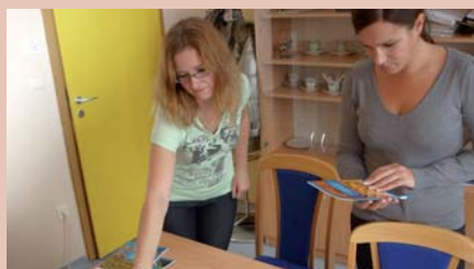
Účastníčky pilotného školenia