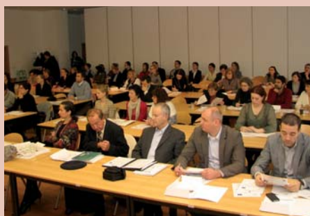
Informačný seminár k vyhlásenej výzve OPV 2010/2.2/02 v Bratislave 14. 01. 2011

26. 10. 2011 SORO zverejnil správu o vyhodnotení výzvy OPV 2010/2.2/02.