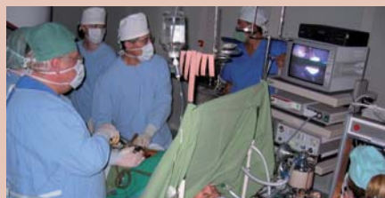
Výučba počas operácie v Nemocnici A. Wintera, Piešťany